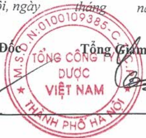
Đinh Xuân Hân