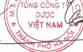
Đinh Xuân Hân